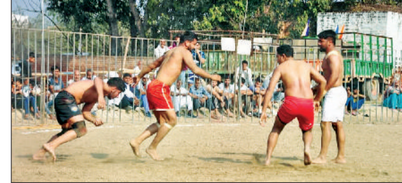
जींद। प्रतियोगिता में दमखम दिखाते हुए खिलाड़ी।

जुलाना हलके के गांव रामकली में रविवार को शहीद भगत सिंह इंटरनेशनल खेल समिति, अंबेडकर खेल समिति, रामकली आजाद क्लब, समस्त ग्रामवासी एवं ग्रामपंचायत द्वारा आयोजित सर्कल कबड्डी महाकुंभ 2026 में हरियाणा, पंजाब के खिलाड़ियों के बीच सर्कल कबड्डी का शौ मैच, महिला वर्ग की चार ऑल ओपन टीमों के मैच और पंचायती मैच में 16 टीमों का मैच आयोजित किया गया। जिनमें फरमाणा महम, अलेवा, अहर, मोरखी, लाखु बुवाना, नगूरुं आदि