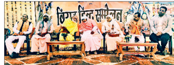
कैथल। हिंदू सम्मेलन में मंच पर बैठे पदाधिकारी।