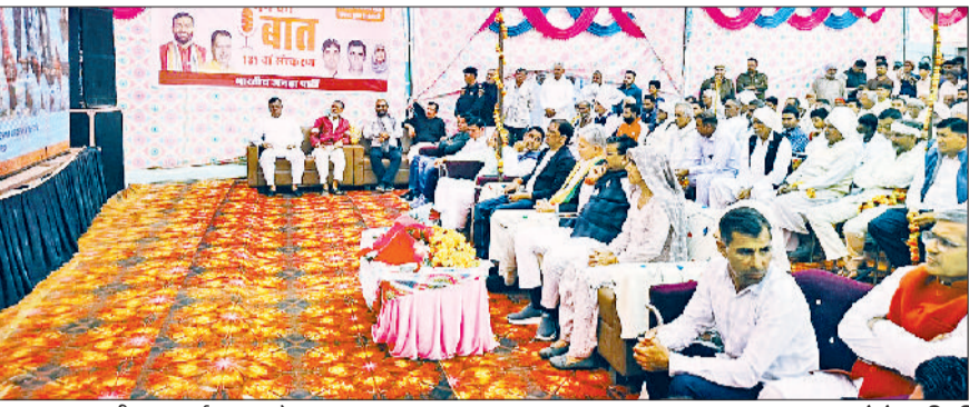
नरवाना। मन की बात कार्यक्रम सुनते हुए।